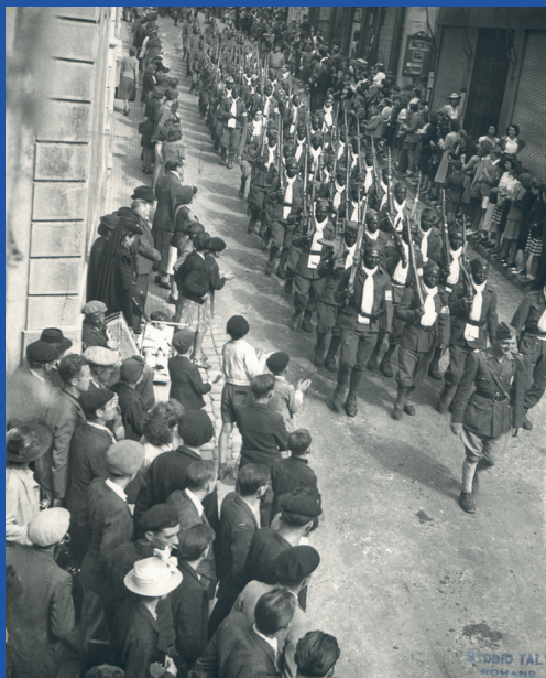
Défilé d'un escadron sénégalais, Côte des Cordeliers, le 23 août 1944. Studio Taly, Romans (ACR 3P256) © Archives & Patrimoine de Valence Romans Agglo

Des tirailleurs sénégalais, issus des troupes coloniales, internés depuis l'armistice de 1940, ont été libérés en juin 1944 par des résistants venus du Vercors. Ils ont pris part à la lutte contre l'occupant avec les FFI, ont vécu les heures les plus sombres du Vercors et ont participé à la libération de Romans, avant de rejoindre la 1ère DFL. La conférence, basée sur le livre d'André Bouisson, fait la synthèse de témoignages et de documents épars. Il sort de l'anonymat les 52 tirailleurs sénégalais du Vercors, retrace leur parcours et ravive leur souvenir.