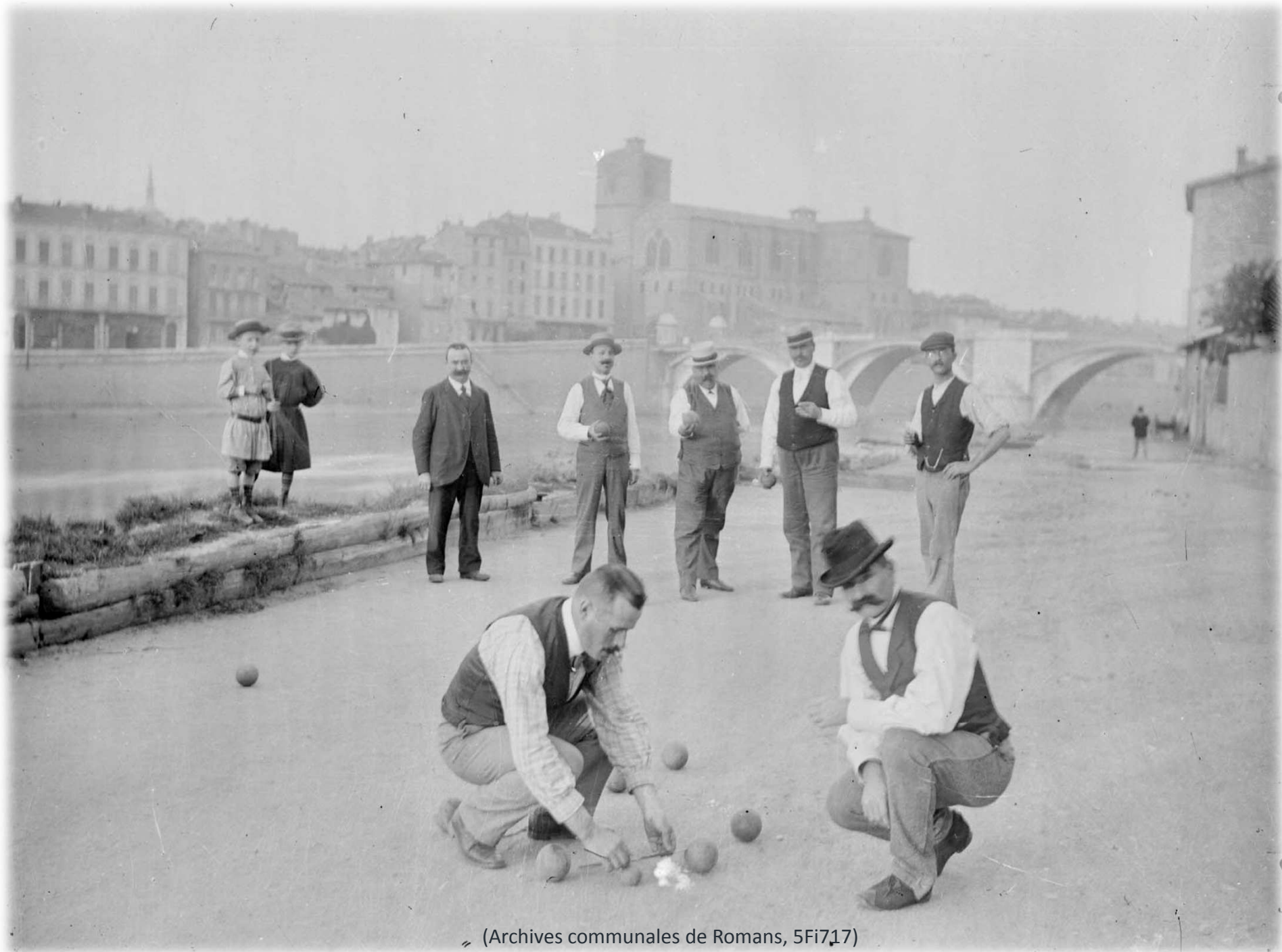
(Archives communales de Romans, 5Fi717)